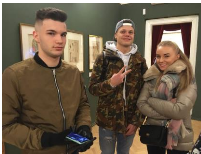
Poznávací zájezd Praha